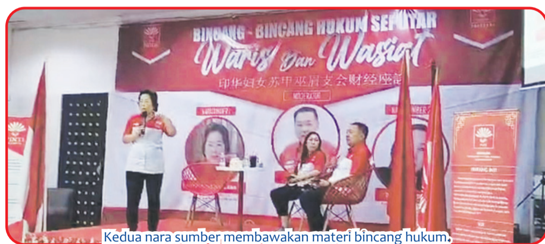
Kedua nara sumber membawakan materi bincang hukum.

SUKABUMI (IM) - Pengurus PINTI Sukabumi (Perempuan Indonesia Tionghoa) bersama pengurus PINTI Jawa Barat, Minggu (29/10) menggelar Bincang Hukum Seputar Waris dan Wasiat, Aula Perkumpulan