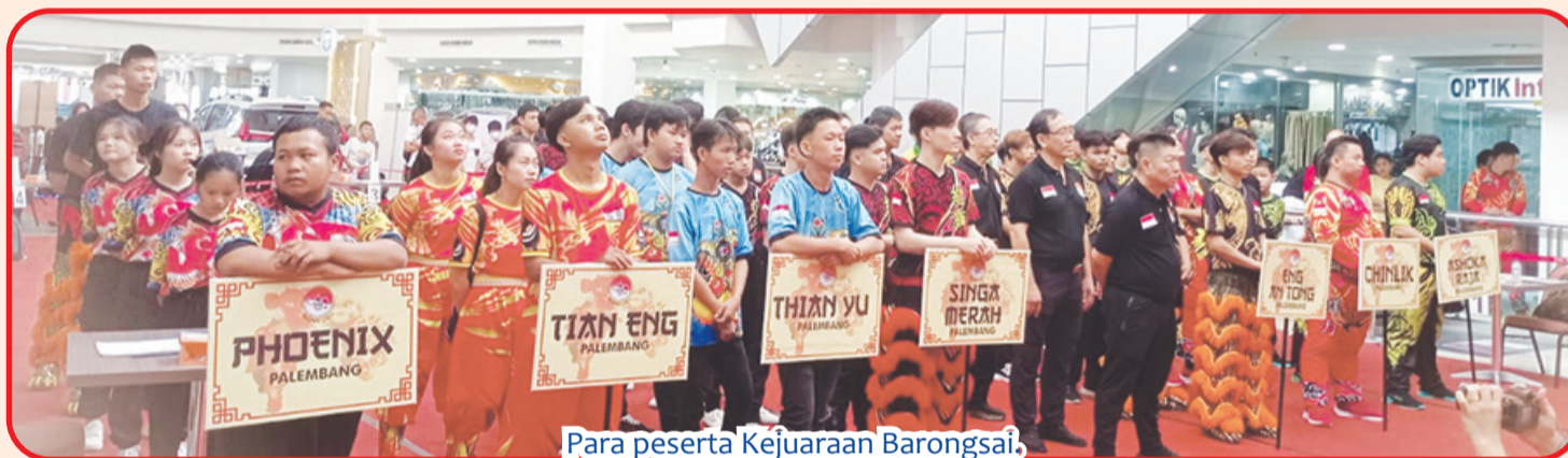
Para peserta Kejuaraan Barongsai.

"Kejuaraan atau lomba kita ini diikuti oleh 10 sarana atau tim. Tujuannya kita melihat siapa yang terbaik antara mereka di Sumsel ini kemudian akan kita persiapkan kemungkinan untuk PON tahun depan mewakili Sumsel," ujarnya.