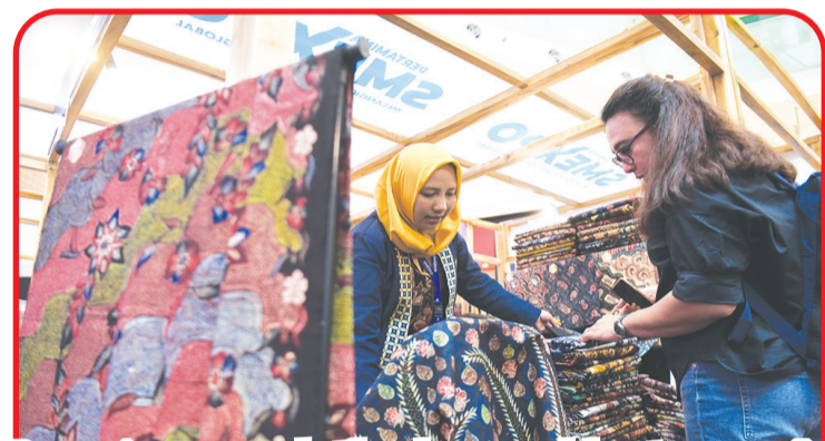
Pengunjung memerhatikan barang salah satu pengrajin UMKM binaan Pertamina dalam Pertamina SMEXPO 2023 di Gandaria City Mall, Jakarta.

Agenda workshop ternyata diminati berbagai oleh berbagai kalangan, mulai dari ibu rumah tangga hingga pelajar. Sebanyak 30 orang peserta hadir dalam kegiatan sulam tersebut. • kris