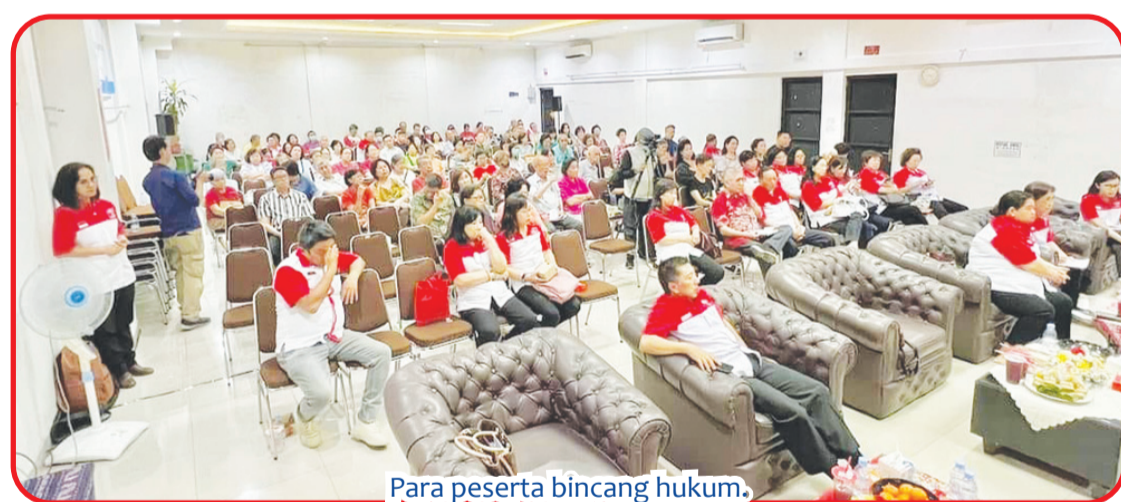
Para peserta bincang hukum.

Dalam sesi seminar atau konsultasi hukum seputar waris dan wasiat tersebut kedua pembicara memaparkan tentang pengertian dan aturan hukum waris dan wasiat