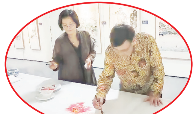
Proses melukis bersama yang melibatkan dua hingga tiga seniman, dalam membuat satu lukisan.