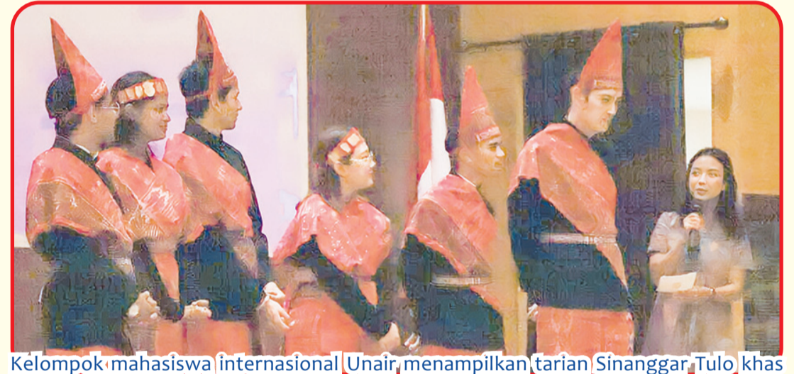
Kelompok mahasiswa internasional Unair, menampilkan tarian Sinanggar, Tulo khas Sumatera Utara.