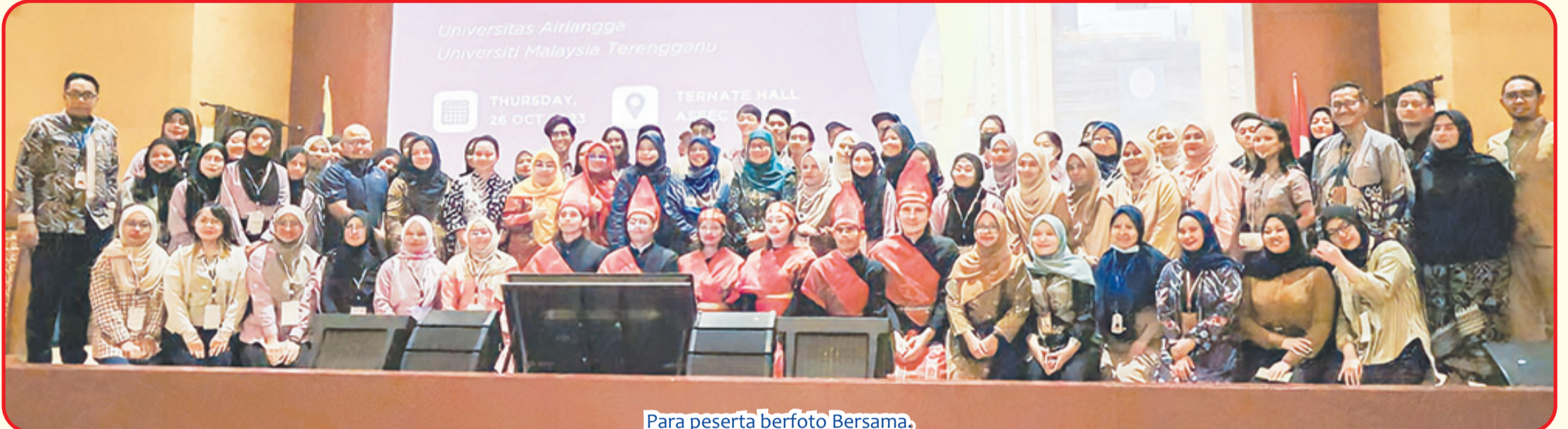
Para peserta berfoto Bersama.

SURABAYA (IM) - Unair (Universitas Airlangga) menjalin kerja sama internasional dengan UMT (Universiti Malaysia Terengganu). Salah satunya dalam bentuk student exchange atau pertukaran mahasiswa.