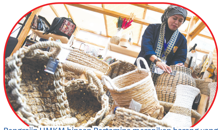
Pengrajin UMKM binaan Pertamina merapikan barang yang dijualnya dalam Pertamina SMEXPO 2023 di Gandaria City Mall, Jakarta.